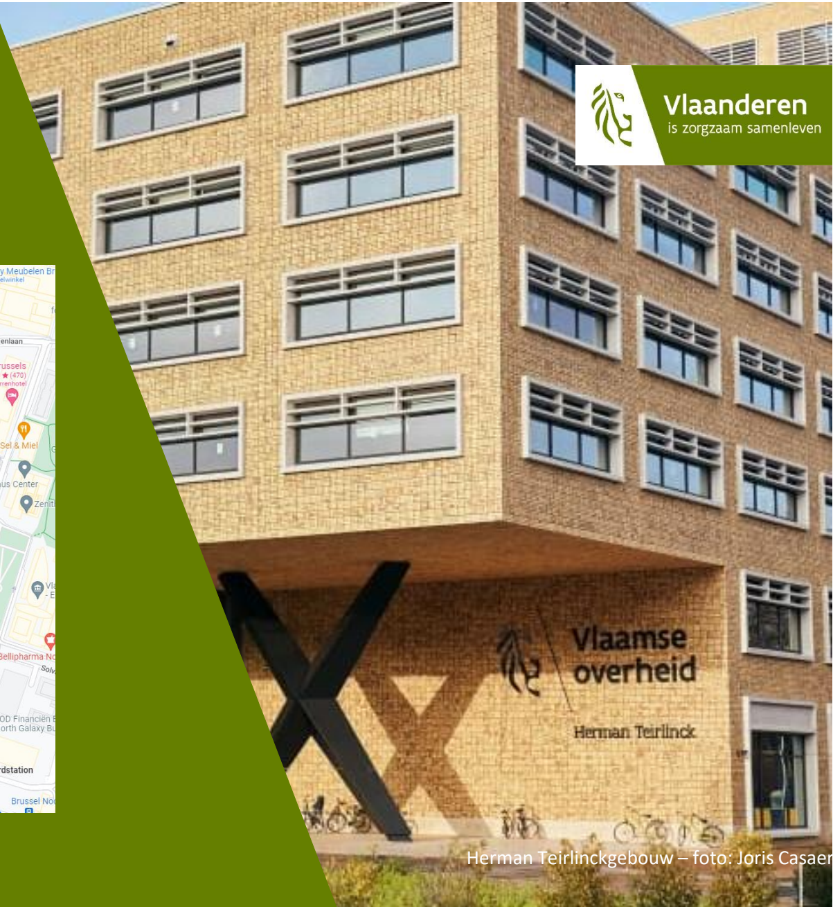
Herman Teirlinckgebouw